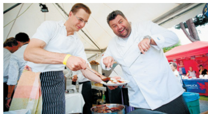
Gute Köche: Mitglieder des Business-Clubs.

Das Fazit des Grundstücksmarktberichts: Nach dem merklichen Rückgang der Preise in 2004 bis 2006 hat sich der Markt trotz der geringen Nachfrage gefestigt. Überwiegend sind Wohnbaugrundstücke zu den Vorjahrespreisen gehandelt worden, so dass die Preisentwicklung als stagnierend zu sehen ist. Aber die Bauplätze liegen trotzdem weiter auf hohem Niveau.